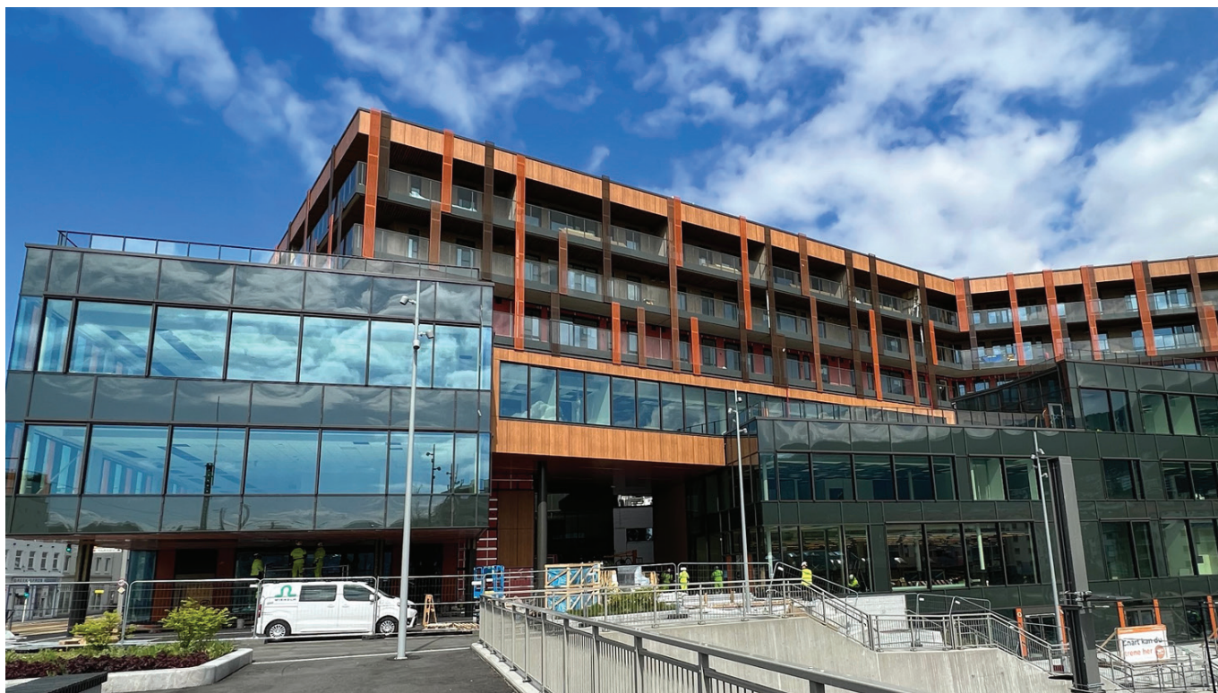
17. juli flytta Helse Vest IKT i Bergen inn i nye lokaler i Kronstad X.

No er dei fleste avdelingane med unntak av desse samlokalisert i Kronstad X. Håpet er at bygget skal bidra til eit samhald på kryss og tvers av avdelingar og fagområde og vere ein arena for samhandling og kollegialt samhald.